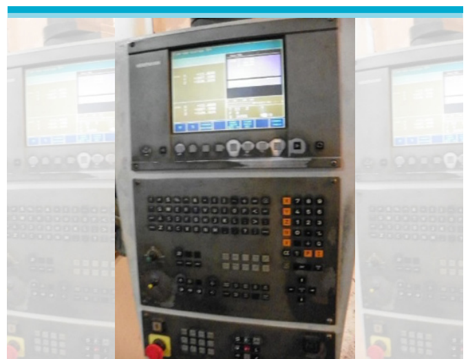
Figura 4: Tela de comando do Centro de Usinagem CNC.

A peça é colocada e fixada dentro da máquina para o seu alinhamento. Feito este procedimento, o operador deve ainda fazer o setup da peça, o qual é realizado utilizando a tela de comando do Centro de Usinagem CNC (Figura 4).