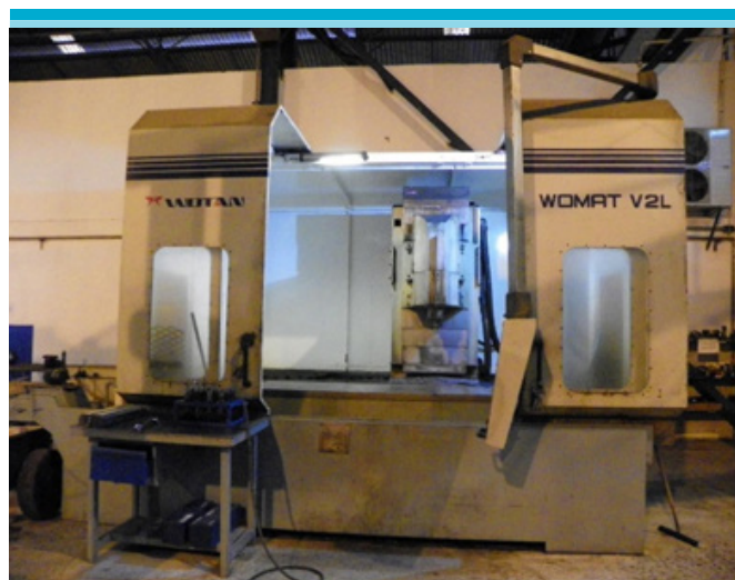
Figura 1: Centro de Usinagem CNC modelo Wotan – Womat V2L.

Observa-se que no processo de trabalho, o objeto – componentes mecânicos para usinar – é caracterizado por uma grande variedade de peças que variam de geometria e tamanho, podendo apresentar desde pequenas até grandes dimensões. O posto de trabalho em foco é o setor de operação no Centro de Usinagem CNC, onde se opera um centro de usinagem vertical da marca Wotan, modelo Womat V2L (Figura 1).